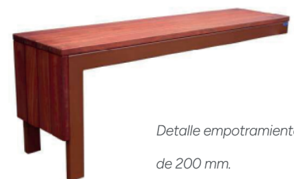
Detalle empotramiento de 200 mm.