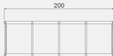
Vista en planta